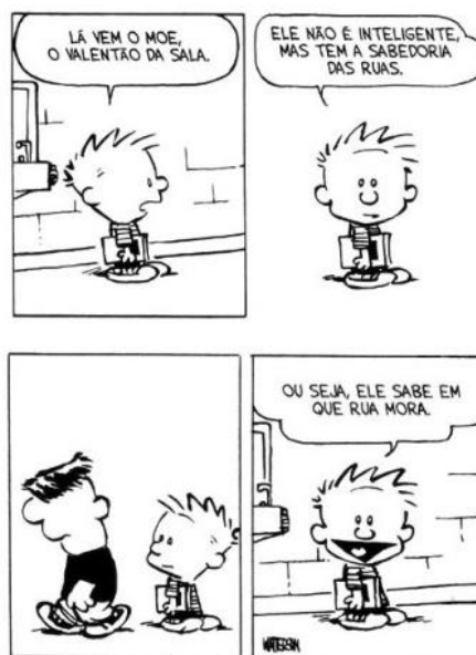
Watterson, B. Calvin e Haroldo.

Leia a charge a seguir para responder às questões de 6 a 10.